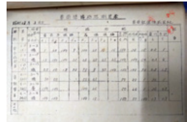
車両絶縁抵抗測定表