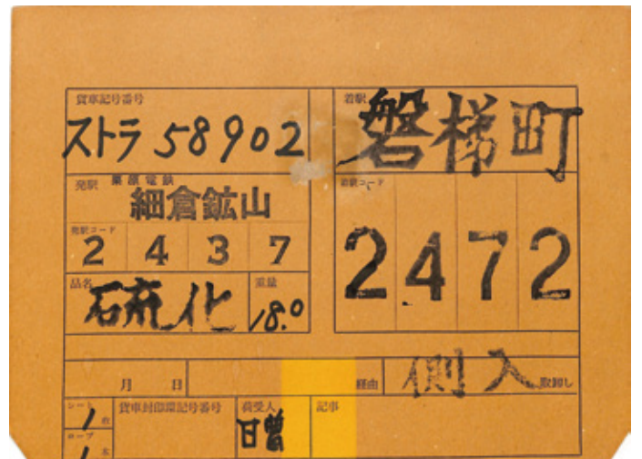
細倉鉾山から福島県磐梯町へ硫化鉾を運ぶための車票

細倉鉾山への延伸には、戦時中だった当時の社会情勢が深く関わっています。1943年3月5日付の『地方鉄道補助許可申請書』には、「細倉工業所生産の軍需必須物の輸送がこの鉄道の生命とも称すべきもの」と記されており、栗原鉄道が戦時中の輸送手段として重要視されていた鉄道であることが分かります。当時の車票をしてみると、細倉鉾山の鉾物は県内であれば石巻へ、県外であれば釜石(岩手県)や羽前水沢(山形県)や君津(千葉県)など遠方地域へ輸送されていたようです。このように細倉鉾山への延伸が実現したことで、鉾物の輸送を栗原鉄道が支えるようになりました。また若柳駅への輸送物には、セメントや肥料などの物資があり、それらの出発地点は新潟県や岐阜県、ひいては愛媛県といった遠方の地域からのものも見られました。このように栗原鉄道は、当時の人々の生活を支える輸送手段として重要なものだったのです。