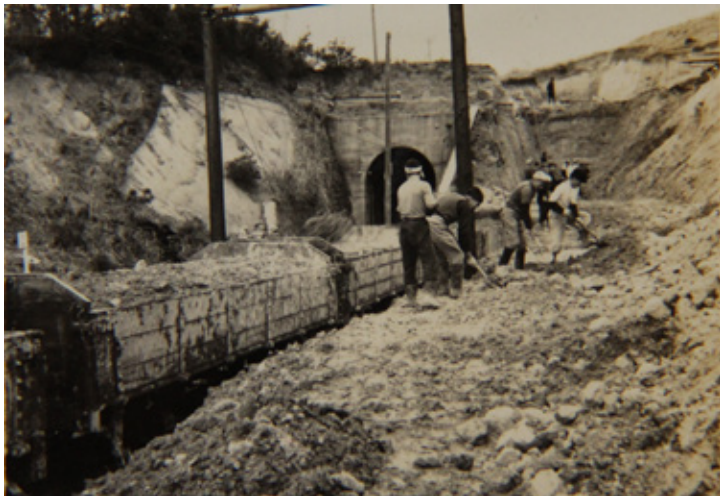
赤坂山での切り崩し作業の様子(トンネルが旧線)

鉄道の線路の幅(軌間)を変えることを指します。栗原鉄道では、軌間762mmから東北本線と同じ1067mmへと広げました。これは、石越駅で貨車の荷物積み替えをスムーズにするためでした。そのため、軌間を広げる工事と新たな車両の購入、既存車両の改造が必要となりました。