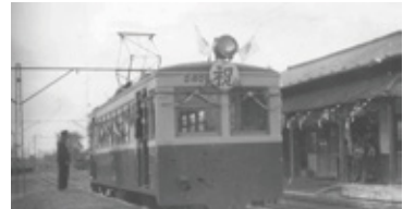
電化記念の列車 モハ2401車両

電化起工式は1950年10月1日、若柳小学校講堂にて実施され、従業員196名、役員、株主が参加しました。