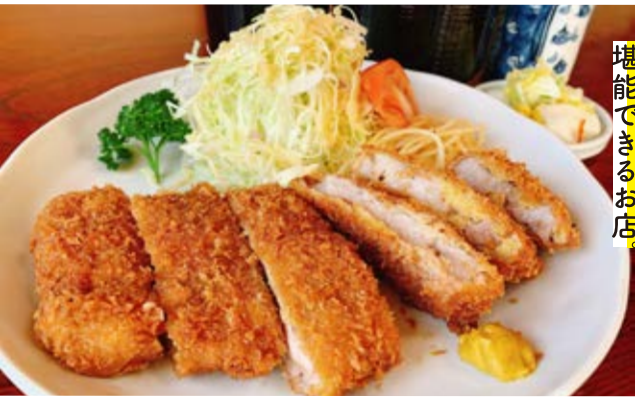
ロースかつ定食(1265円)

地元へ愛される隠れた名店といえば荒浜屋。平日は若柳で働く人たちの食堂として大人気。特にボリューム満点のカツ丼と細切れ麺に、たっぷり野菜の味噌ラーメンは人気メニュー。品数が多いのも人気の秘密!