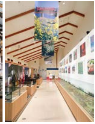
資料館はジオラマやグッズ売り場がある

くりはら田園鉄道公園 くりでんミュージアム 旅客・貨物輸送を行った単線ローカル線で、「くりでん」の愛称で親しまれていた「くりはら田園鉄道」が惜しまれながら廃線となったのは2007年(平成19年)のこと。その歴史を後世に伝えるのがくりでんミュージアムです。敷地内にある旧若柳駅では「くりでん乗車会」や「レールバイク」などイベントを開催。隣接する「くりはら田園鉄道公園 芝生広場」は遊具もあり、憩いの場として多くの皆様にご利用いただいております。