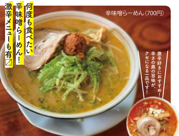
辛辣噌らーめん(700円)