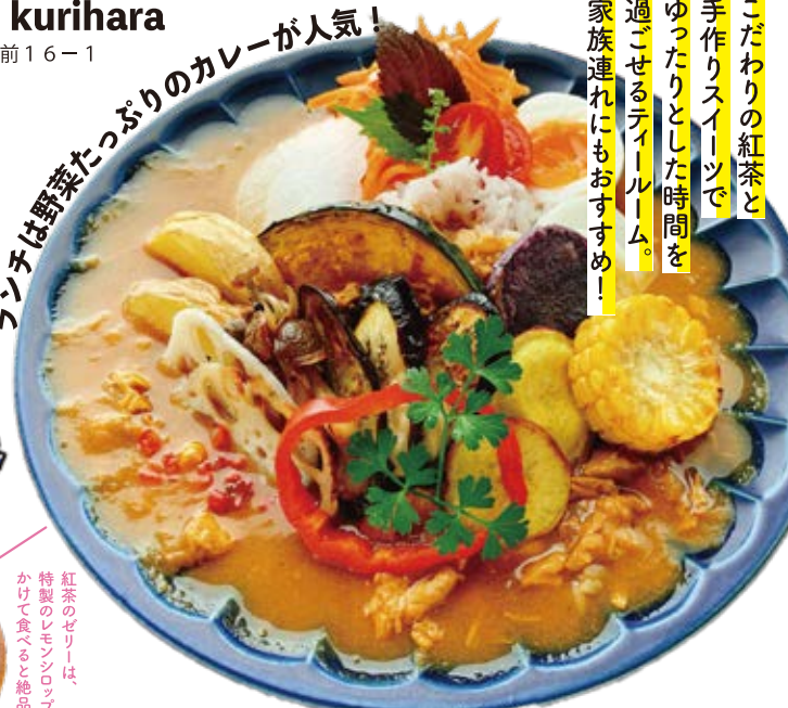
IRODORIカレー (紅茶のゼリー/ストレートティー付きのセット)1,100円