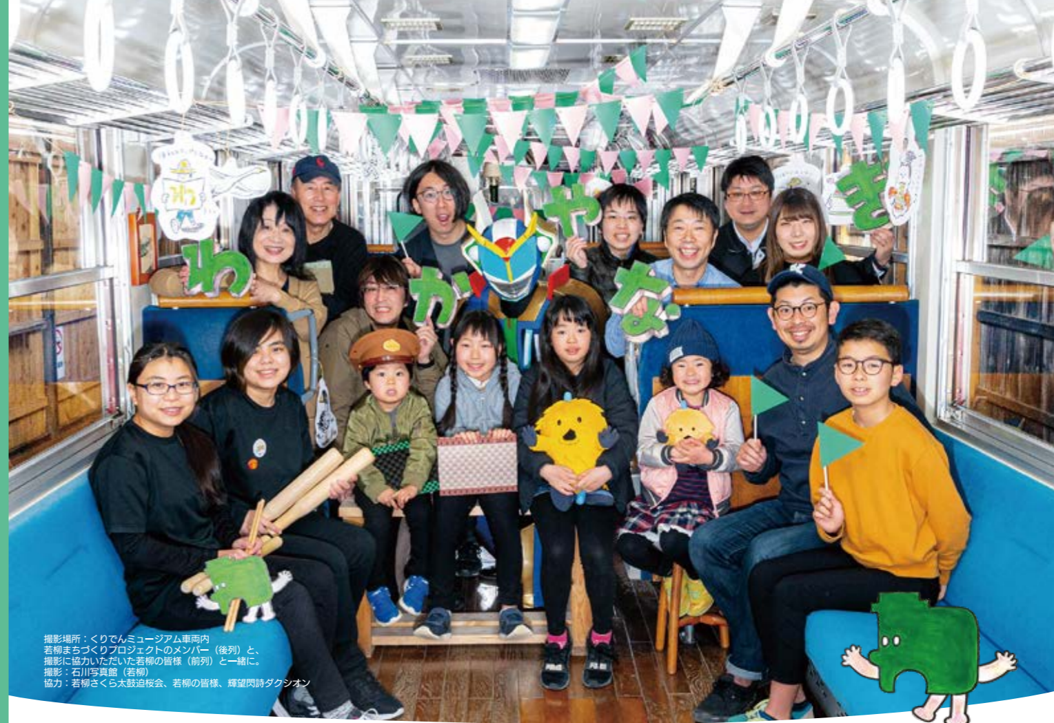
撮影場所：くりでんミュージアム車内 若柳まちづくりプロジェクトのメンバー（後列）と、撮影に協力いただいた若柳の皆様（前列）と一緒に。 協力：若柳さくら太鼓迫教会、若柳の皆様、輝望閃詩タクシオン