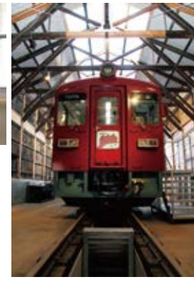
車庫にある車両は中に入ることが出来る

宮城県伊豆沼・内沼サンクチュアリセンター 宮城県伊豆沼・内沼サンクチュアリセンターでは、飛来する野鳥や沼に生息する多様な生物について学べます。2015年にリニューアルし、触れて学ぶ展示が人気。イラストレーター塩川いづみさんによる渡り鳥の絵が壁面に描かれているのが素敵! また築館、登米市に昆虫館、淡水魚館がそれぞれあり、すべて無料で楽しめます。