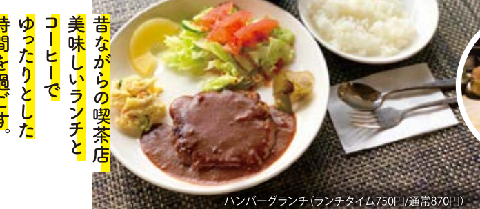
ハンバーグランチ(ランチタイム750円/通常870円)