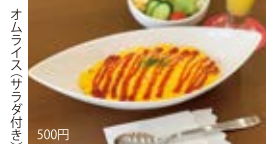
オムライス(サラダ付き) 500円