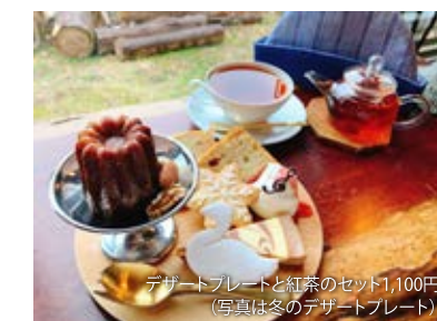
デザートプレートと紅茶のセット1,100円 (写真は冬のデザートプレート)

●住所: 栗原市若柳川北大袋前1 6-1 営業開始: 10:00-18:00 定休日: 水・木(変動あり) 駐車場あり